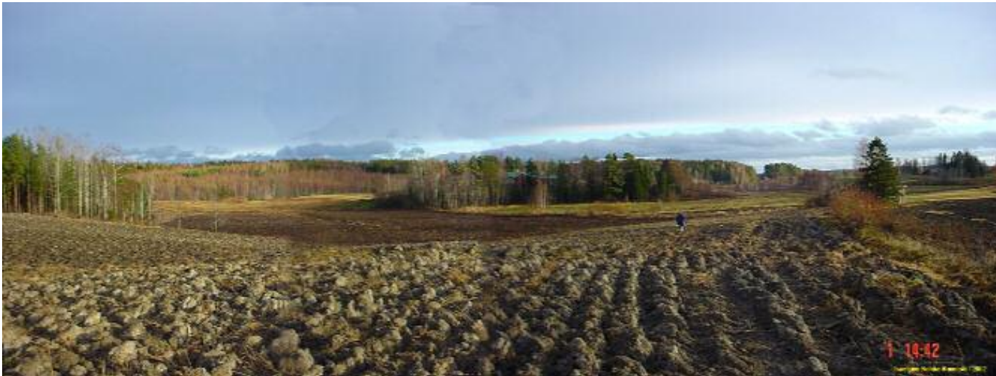
Kuvattu etelään. Löytöjä kuvan oikeassa laidassa olevalta pellolta