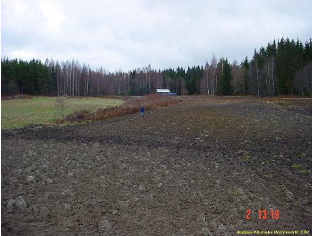
Kuvattu pohjoiseen. löydöt kuvan keskeltä, missä Timo Sepänmaa seisoo, taustalla Ladon kohdalla teiden risteys.