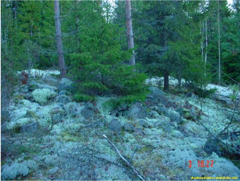
Kuvattu kaakkoon. lapinraunio kuusennäreen alla.