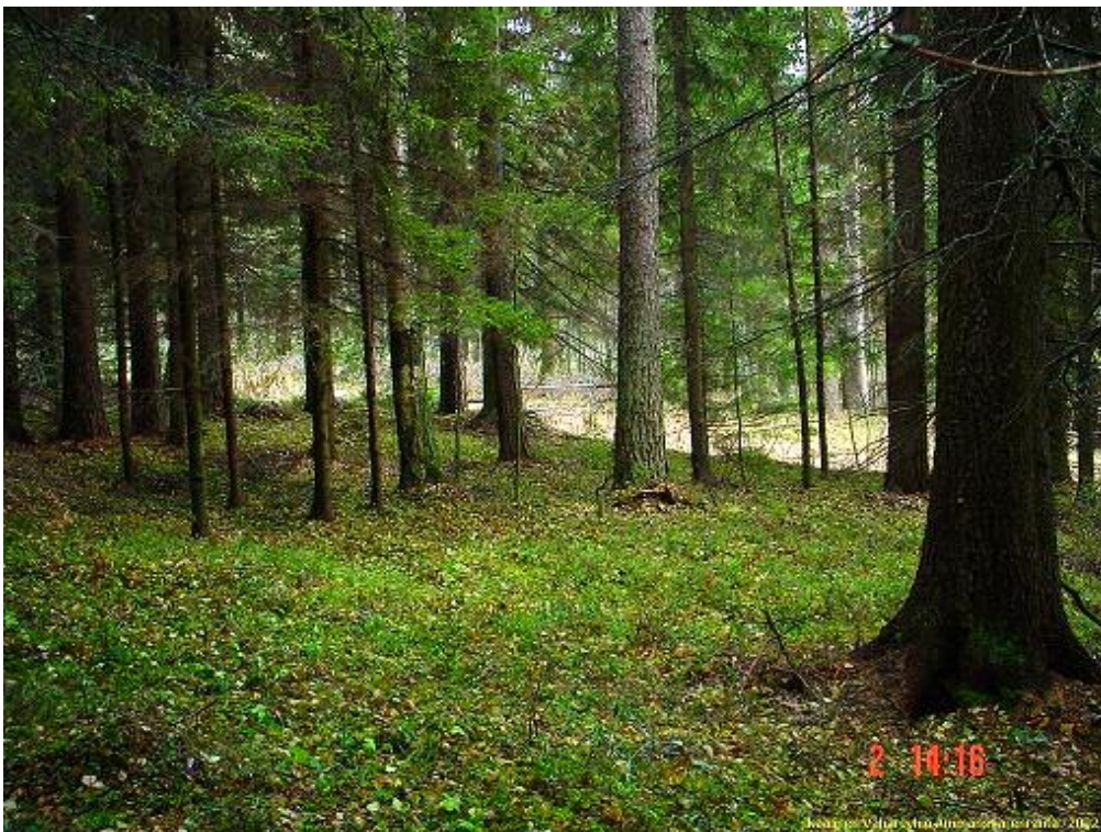
Kuvattu itään. Vanhaa kaivausaluetta kuvan etualalla metsässä.