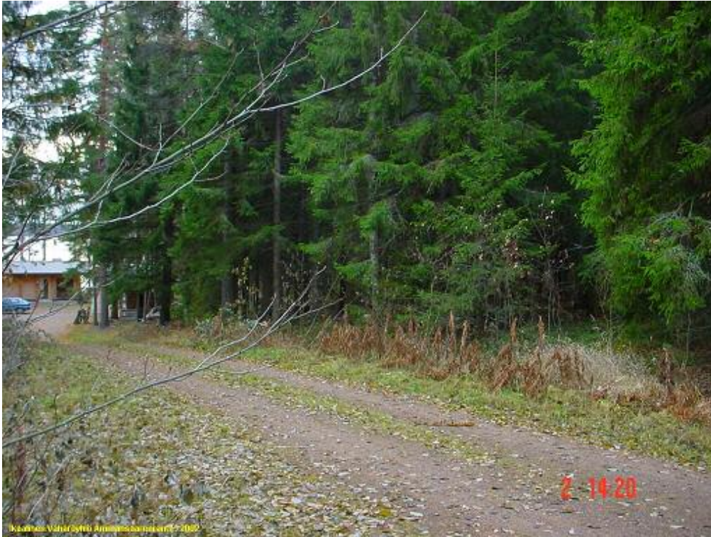
Kuvattu etelään, pääosa asuinpaikasta metsässä