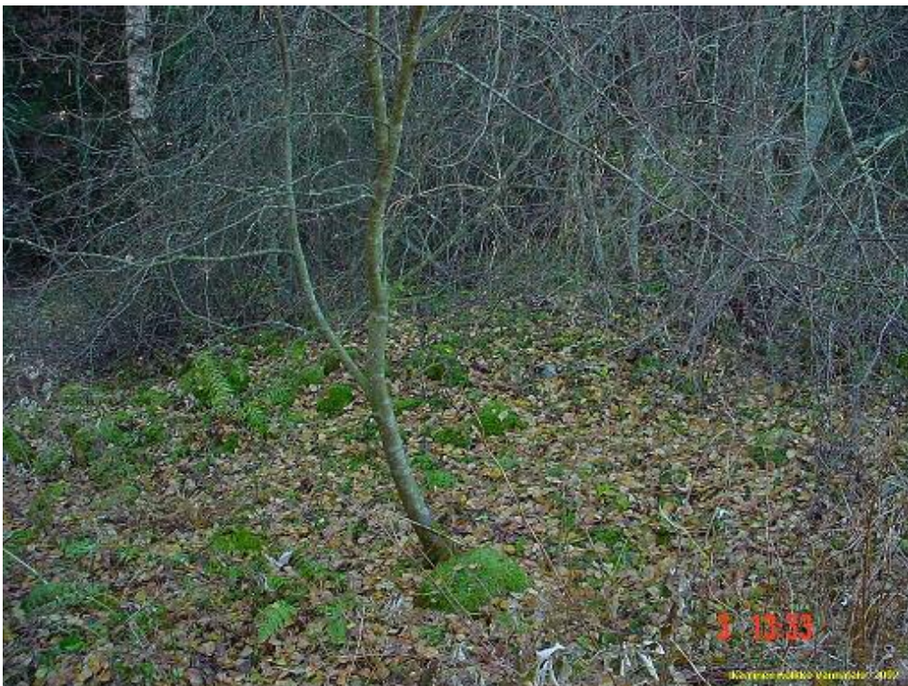
Kiviraunio, peltoraunio rantaan menevän tien laidalla