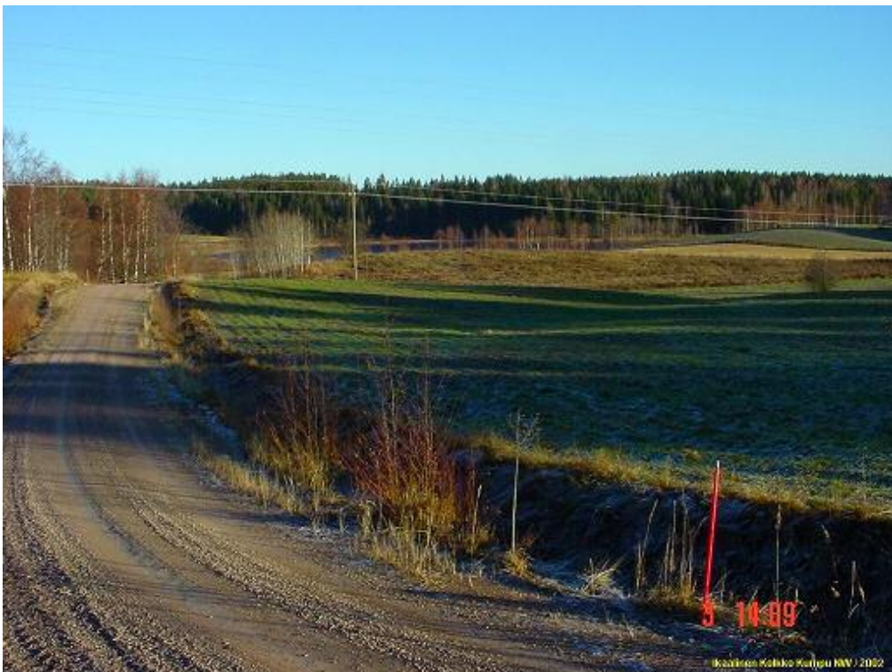
Kuvattu itään. Asuinpaikkaa sähkölinjan alla heti tien oikealla puolen.