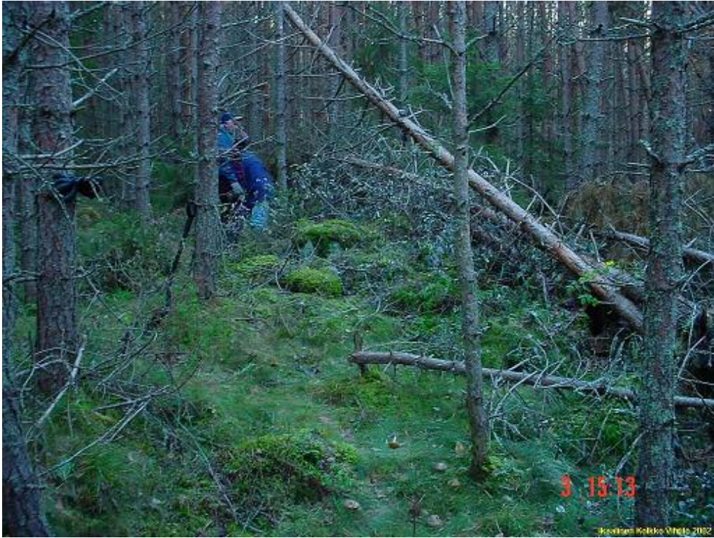
Kuvattu länteen. Röykkiö kaatuneiden rankojen alla.