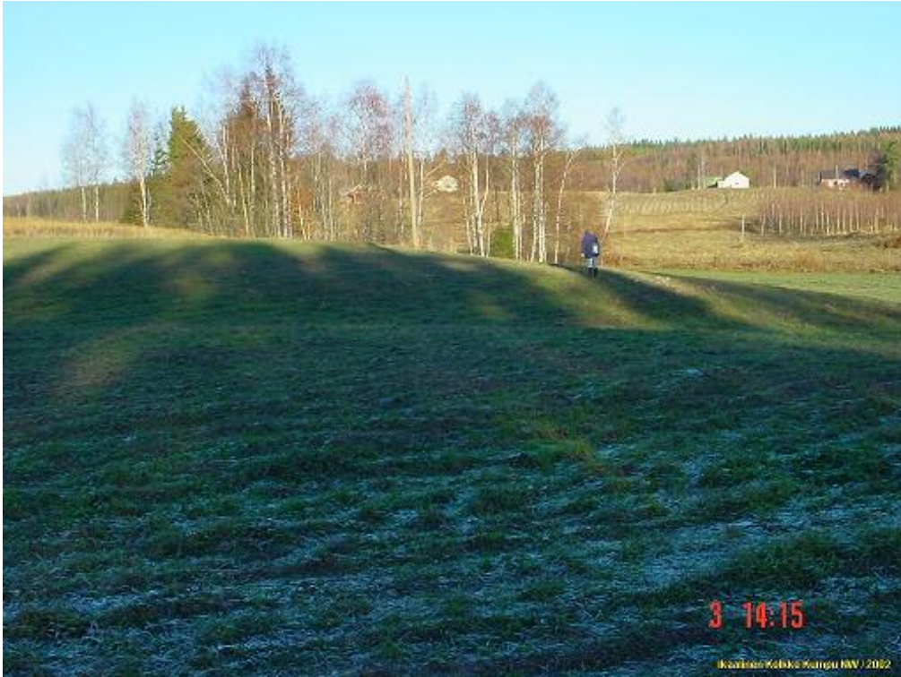
Asuinpaikkaa taaempänä olevalla peltokumpareella (auringossa). Kuvattu pohjoiseen.