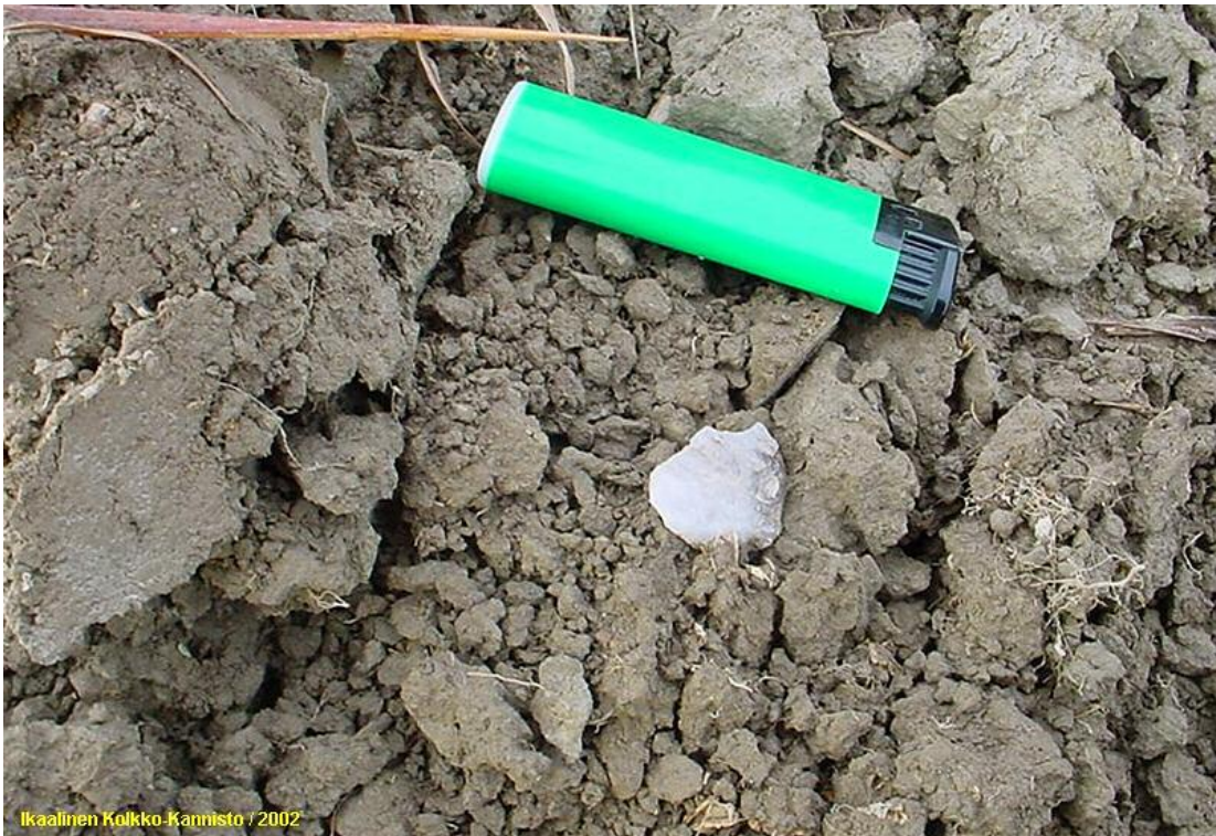
Kvartsi-iskos in situ (sytytin mittakaavana).