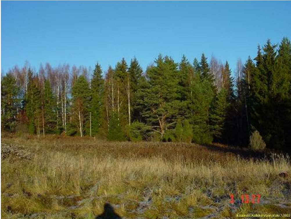
Kuvattu pohjoiseen pellon reunasta, talo jää kuvan vasemmalle puolelle. Aiemmpien havaintojen koordinaatit ja kuvaus viittaa tähän maisemaan.