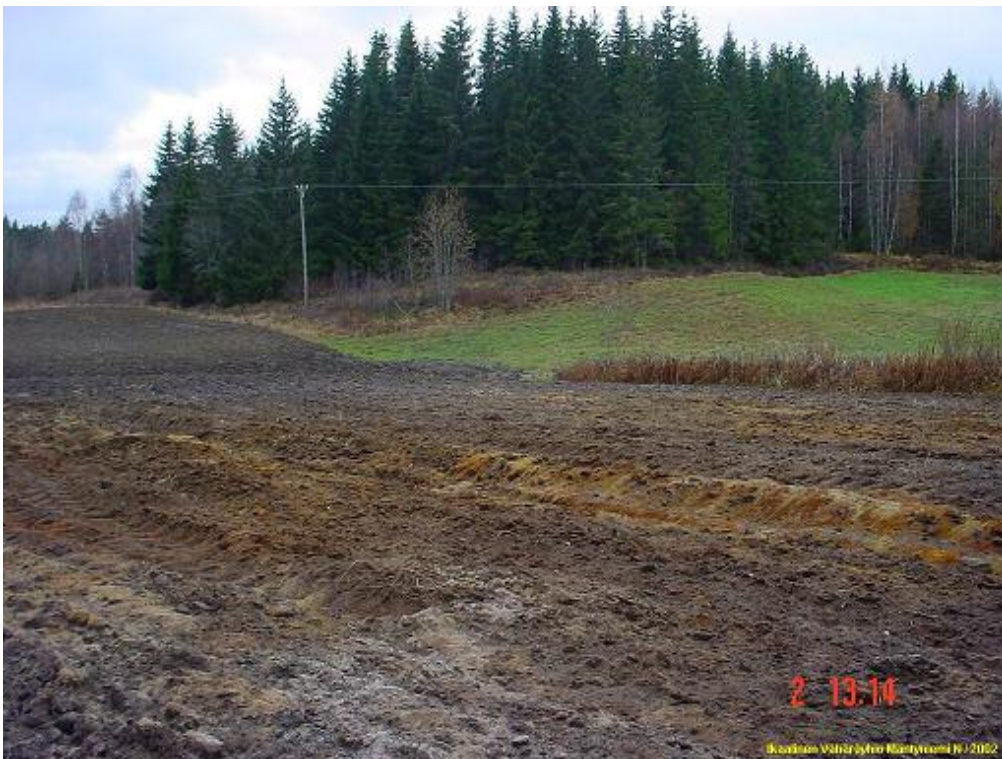
Kuvattu lounaaseen. Löydöt kuvan keskeltä pellon reunasta.